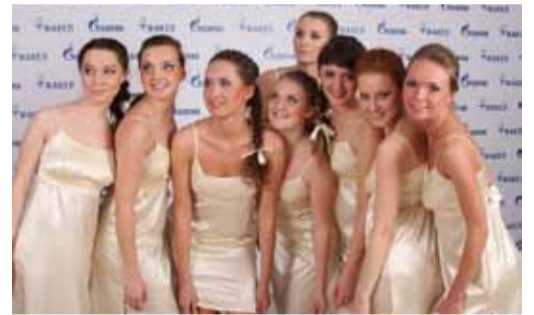
Танцевальный коллектив «В центре внимания»