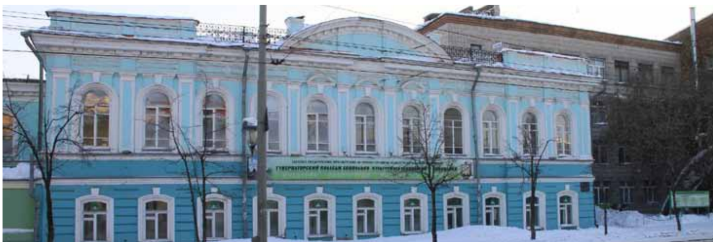
Губернаторский колледж социально-культурных технологий и инноваций. Здание, построенное в 1875 году, является памятником архитектуры федерального значения. В дореволюционное время это был доходный дом купчихи Некрасовой