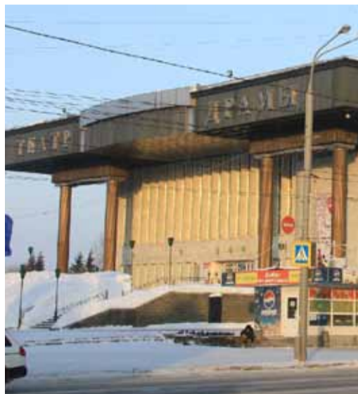
Томский театр драмы. На его сцене с гастрольями выступали такие великие артисты России, как Михаил Ульянов, Анастасия Вертинская, Марина Неёлова