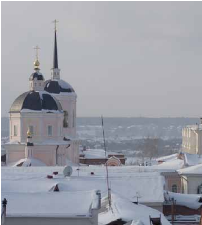
Вид на Томск с Воскресенской горы

С легкой руки авторов фильма «Джентльмены удачи» все жители нашей страны знают, что археологи из Томска время от времени находят золотые шлемы. А вот фразу дочери московского профессора почему-то многие оставляют без внимания. Между тем, в ней (фразе) заключена важная характеристика томичей: «В прошлом году, когда мы были в Томске, ваш профессор Зеленцов нас так принимал!». Да, гостеприимство в крови у жителей города. И угощаем мы не только за столом разными вкусностями, но и на улицах... Томском.